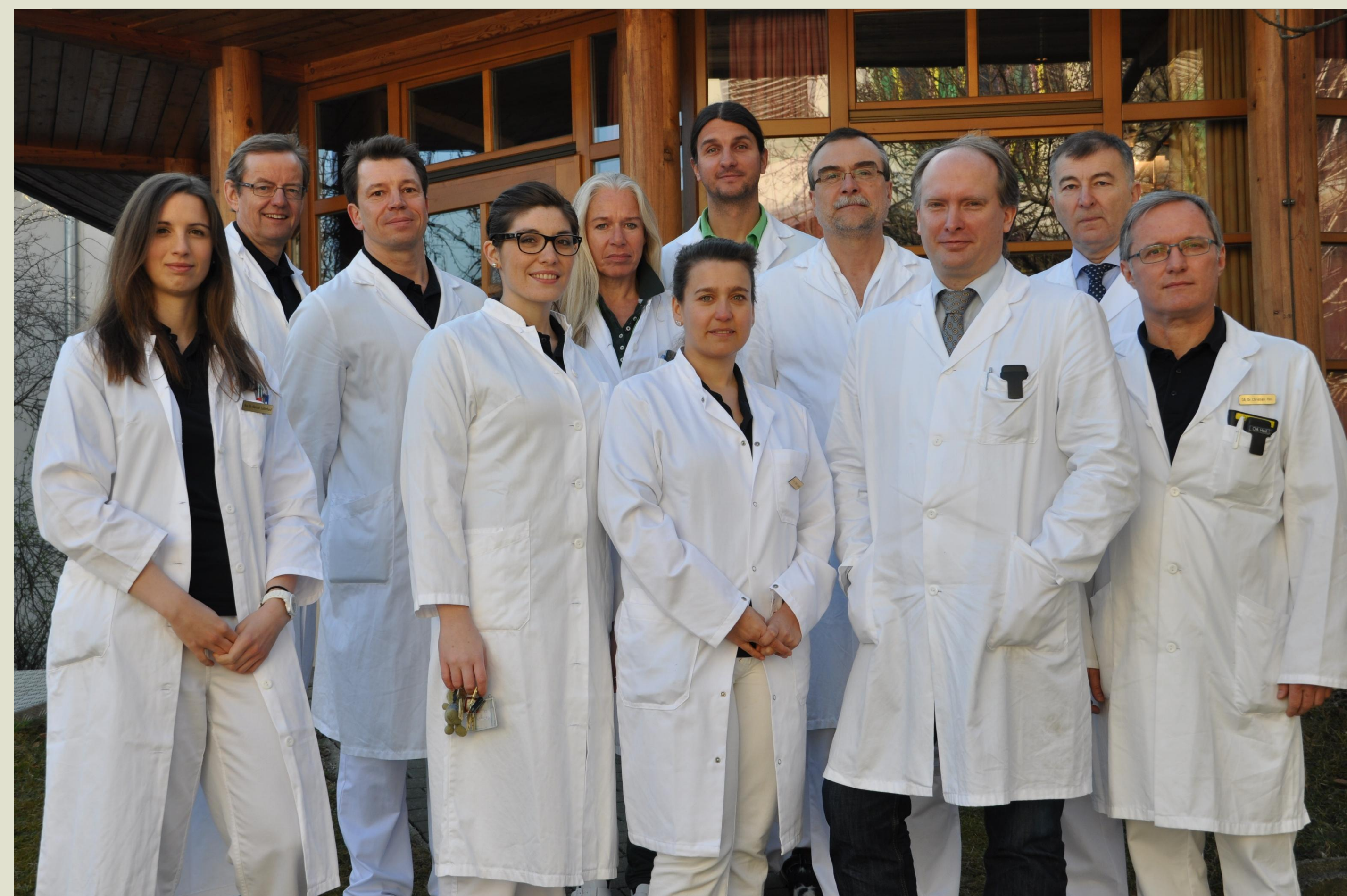
FIG.1 Team der Universitätsklinik für Kinder- und Jugendchirurgie